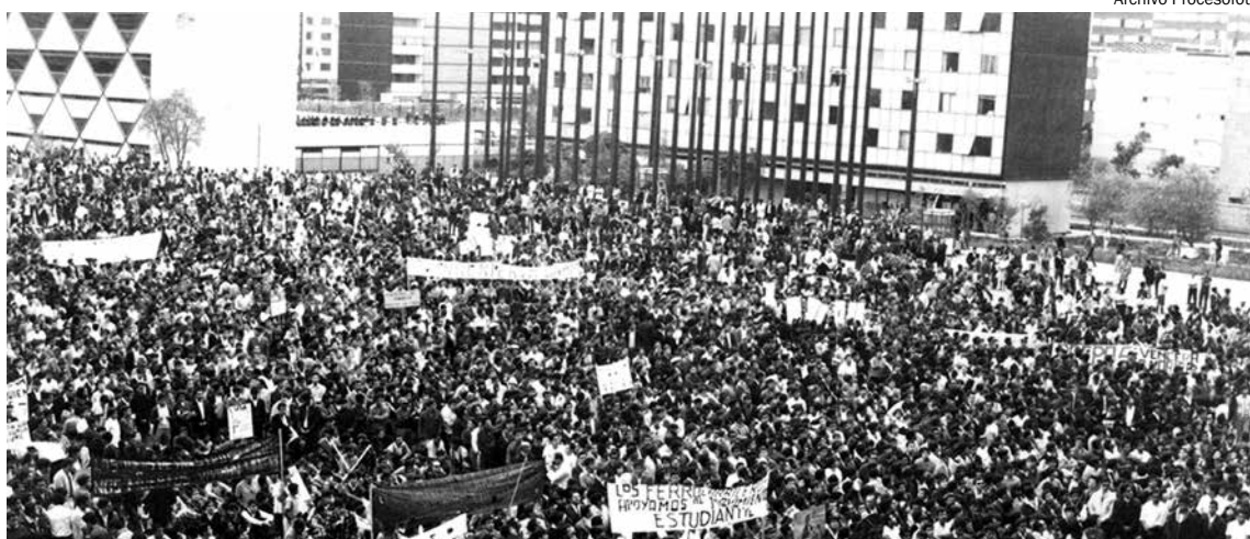
Protesto de 1968 em Tlatelolco, no México, uma demonstração de toda a agitação que marcou o país naquele ano

Embora não tenham sido vitoriosas, as explosões sociais vistas em 1968 são exemplos de coragem da juventude e dos trabalhadores na luta contra seus opressores. A necessidade de aprender com as lições e os erros cometidos nessa época tornam o estudo dos muitos acontecimentos que marcaram este ano uma tarefa obrigatória para os que pretendem manter vivos os sonhos daquela geração: destruir o capitalismo e construir uma nova sociedade, na qual todos possamos ser realmente livres de toda a opressão e exploração.