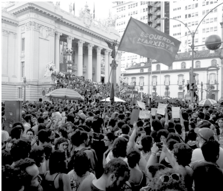
Execução de Marielle despertou mobilizações em várias cidades do país

Estão colocadas também duas análises distintas sobre as motivações dos crimes. A