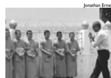
Obama visita o Laos, país devastado pelos EUA

Por trás da propaganda e das manchetes, está a orientação da burguesia imperialista norte-americana para garantir seus interesses capitalistas em todo o mundo. Obama, negro e “Nobel da Paz”, cumpriu o papel de executor dessa política.