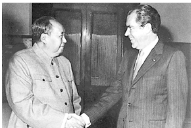
Mao Tsé-Tung curva-se aos EUA e recebe o presidente Richard Nixon na China

O proletariado chinês, com tantas tradições revolucionárias, certamente saberá reorganizar suas forças para lutar contra a máfia capitalista que domina o país a serviço do capital internacional, e ser um importante elemento do combate pela revolução mundial.