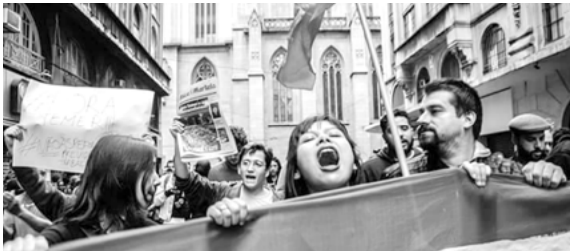
Manifestação em São Paulo com 20 mil no dia 7 de setembro ocorreu simultaneamente a protestos por todo o Brasil

Todos se reuniram em assembleia, votaram por ir até a Paulista e decidiram que a faixa da Liberdade e Luta seria a frente do ato. A passeata subiu a Avenida Brigadeiro ao som de “Ai... ai, ai, ai... Ai, ai, ai, ai, ai, ai... Se empurrar o Temer cai” e, não menos importante, “Que coincidência, não tem polícia, não tem violência!”. Algumas motos da PM apareceram para fechar algumas vias, e um grupo maior de policiais se posicionou na Praça Roosevelt, mas não era o mesmo aparato policial dos atos anteriores ou o ostensivo aparato que acompanhou o ato do dia seguinte, que foi até a casa de Michel Temer.