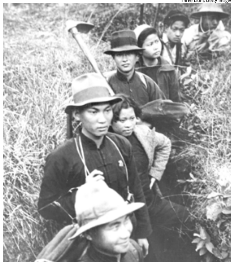
Apenas oito mil sobreviveram à Longa Marcha (1934-1936)