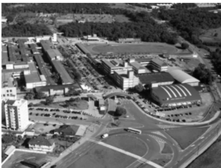
Uma das maiores universidades de Santa Catarina, Univille precisa ser federalizada

A Univille faz parte do Sistema Acafe, sistema que tem seus fundamentos baseados no comunitarismo cuja origem remete às instituições religiosas europeias. Essas tinham o objetivo de