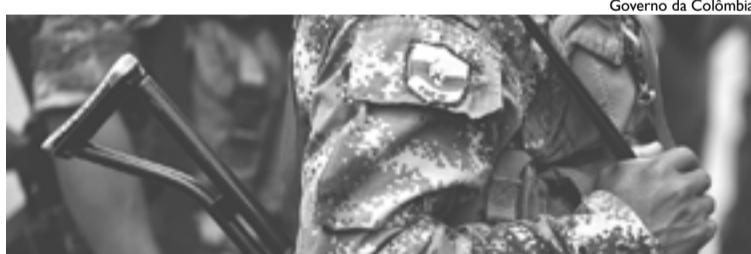
Acordo entre Farc e governo enfrenta resistência dos latifundiários

O acordo conta com o apoio do governo dos EUA, pois não representa nenhum risco para o capitalismo. As companhias minerais e petrolíferas poderão explorar as