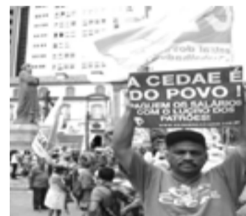
Manifestantes contra ajuste fiscal

Mas alguém acredita que essas medidas são capazes de tirar o RJ do atoleiro? A crise possui raízes MUITO mais profundas, trata-se da crise do capitalismo como um todo, ela não se resume ao problema da corrupção ou “má gestão”. É uma crise em escala interna-