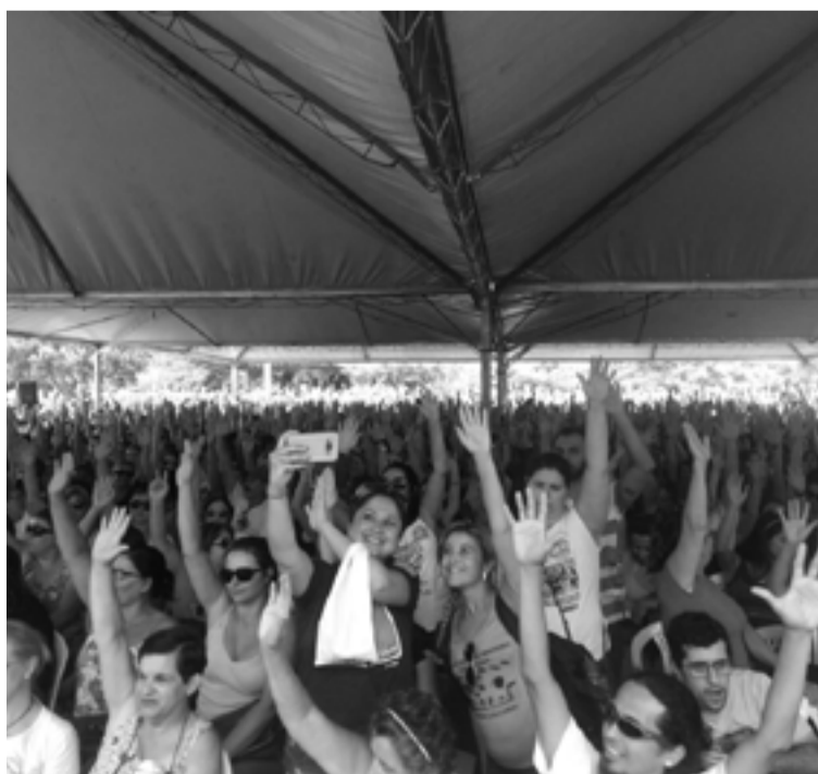
Assembleias e manifestações foram combinadas com diálogos nos bairros

No momento atual, na luta contra a Reforma da Previdência e a Reforma Trabalhista, o exemplo dos trabalhadores de Florianópolis deve ser seguido pelas CUT, demais Centrais Sindicais e movimentos populares que se reivindicam da luta de classes. Assumindo essa experiência como norte, precisamos construir uma Plenária Nacional que discuta formas e meios de derrotar contra a Reforma da Previdência e a Reforma Trabalhista do Presidente ilegítimo Michel Temer. Viva a luta de classes! Viva a classe trabalhadora! Viva o socialismo!