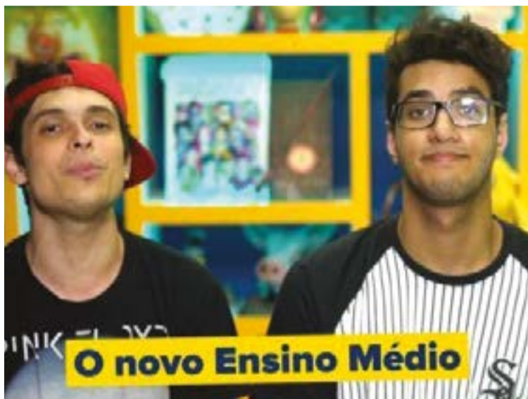
Governo Temer pagou youtubers para fazer parecer a reforma como positiva

As propagandas afirmam que quem conhece e entende a reforma concorda com ela. Utilizam uma pesquisa contratada pelo próprio governo ao IBGE, segundo a qual, 72% dos entrevistados concordam com a medida. Isso é medido pela resposta à tendenciosa pergunta: “O senhor é a favor ou contra a reformulação do ensino médio que, em linhas gerais, propõe ampliação do número de escolas de ensino médio em tempo integral, permite que o aluno