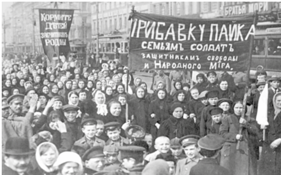
Manifestação de 23 de fevereiro de 1917, com trabalhadores do Moinho Putilov em Petrogrado

E marchando juntos, conscientes de seu papel transformador, homens e mulheres levantarão uma nova sociedade por cima dos escombros desta de bárbaras. Uma nova sociedade que, liberando as forças produtivas da apropriação privada, irá liberar homens e mulheres para viverem plenamente o significado de pertencer à Humanidade.