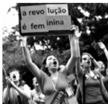
Manifestação de 8 de março em SP, marcada por chamado internacional

Assinado por diversas acadêmicas, o chamado pretende realizar uma luta internacional das mulheres convocando àqueles que se reivindicam do feminismo para “construir em seu lugar um feminismo para os 99%, um feminismo de base, anticapitalista; um feminismo solidário com as