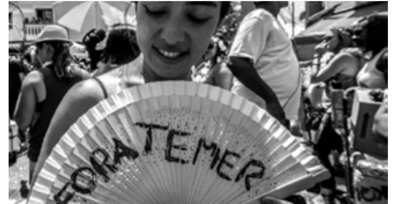
Manifestações de foliões durante Carnaval misturaram festas com protestos

Os exemplos internacionais demonstram que em uma situação convulsiva, a falência política dos partidos reformistas