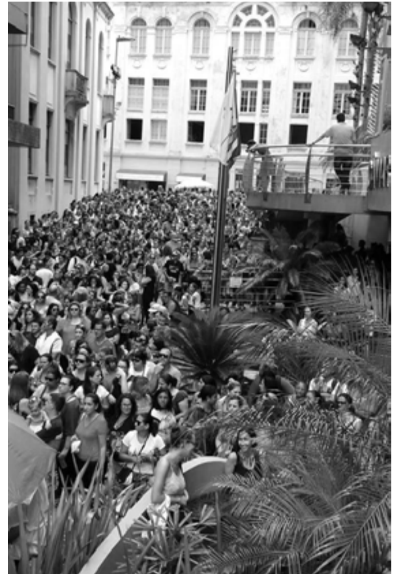
Dia 16 de janeiro, aprovação do início da greve contra “pacote de maldades”

No dia 21 de fevereiro fomos surpreendidos com a intimação da Desembargadora Vera Lúcia Copetti que, a pedido do Prefeito, abriu negociações entre as duas partes, agendada para o dia 22 de fevereiro. A proposta que surgiu na mesa foi apresentada no mesmo dia à categoria, que decidiu interromper a assembleia até o dia seguinte. No dia 23 de fevereiro a assembleia continuou em clima