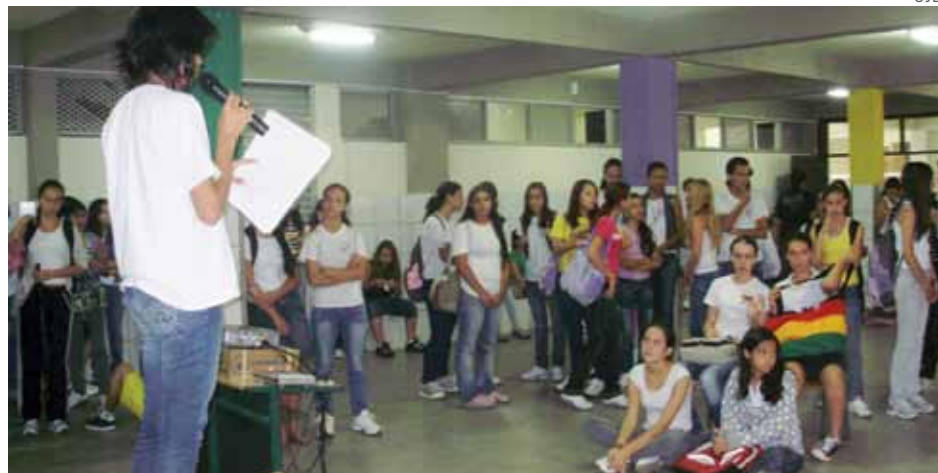
Assembleia da UJES em escola pública em Joinville/SC

Em 1992 a Ujes desempenhou um papel fundamental na organização do “Fora Collor”. Foi a maior mobilização que a cidade havia visto até então. No mesmo ano foram construídos grêmios em quase to-