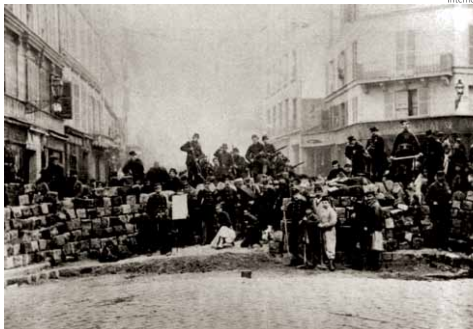
A barricada dos insurretos da Comuna de Paris

A Comuna oficializou o fim do exército permanente e sua substituição pelo armamento geral do povo (..) foram criadas em cada bairro milícias populares