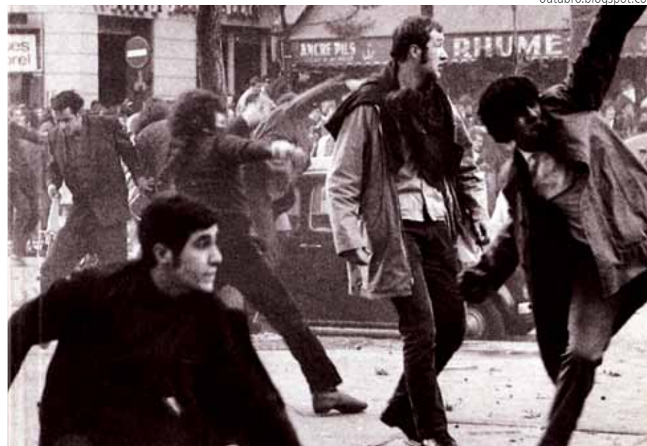
Manifestantes se enfrentam com a repressão em Paris

Unidos aos trabalhadores, os estudantes ganham força. Centenas de milhares tomariam as ruas de Paris em manifestações. O primeiro ministro Pompidou reabriria a universidade de Sourbone, reconhecendo depois em suas memórias: “ Preferir dar a Sorbone aos estudantes que vê-la tomada pela força ”. A greve geral convocada resulta em ocupação de fábricas, que continuarão a produzir sob controle operário, criando um vácuo de poder. Nem o Partido Comunista Francês (PCF) e a Central Sindical (CGT) estavam prontos para lidar com isso.