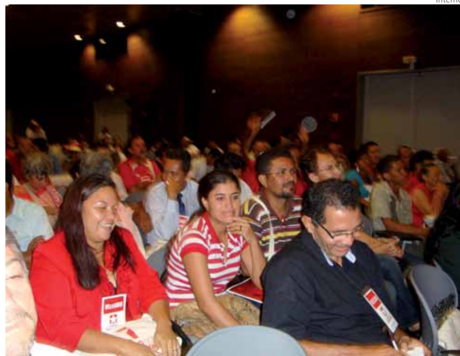
O PT deve voltar a ser um partido democrático e de luta

6) Elaboração de agenda para campanhas financeiras de massa com o objetivo de arrecadação financeira para sustentação do partido.