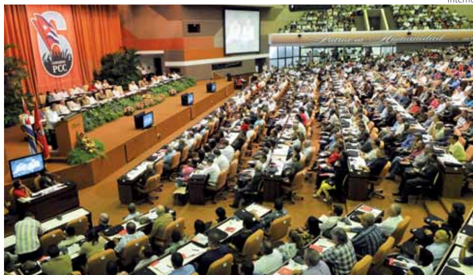
Congresso do Partido Comunista Cubano: plenária final

A situação em que se encontra Cuba é só mais um exemplo de que é impossível construir “o socialismo em um só país”. Como acontece com todos os países, a economia