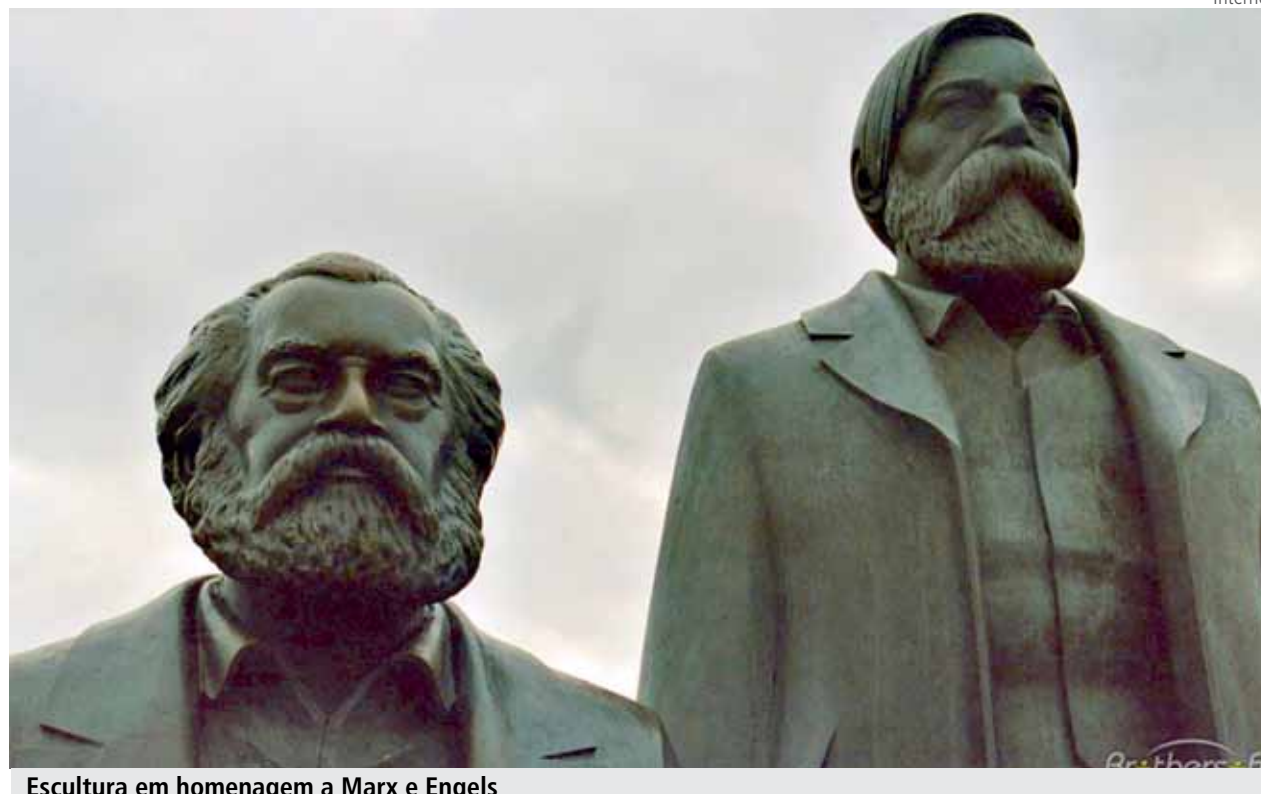
Escultura em homenagem a Marx e Engels