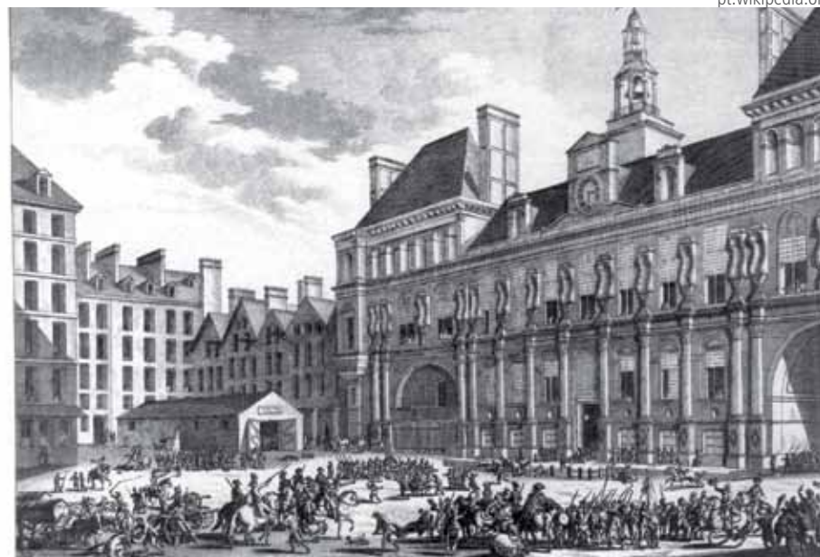
Obra de Pierre Gabriel Berthault retrata os enfrentamentos em Paris

E hoje, muito mais que na França de 1871, está claro que em nenhum país do mundo a burguesia é capaz