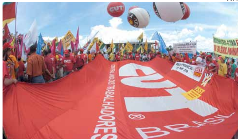
Mobilização pelo salário mínimo de R$ 580,00 em Brasília

A DN da CUT convoca para 3 a 7 de outubro de 2011 a décima terceira Plenária Nacional da CUT, a se realizar em São Paulo. Nesta Plenária estará reunida a grande maioria do movimento sindical que elegeu o governo Dilma. Essa maioria já está vendo as promessas de campanha desaparecerem. Desde já, nas plenárias preparatórias a tarefa central é preparar os trabalhadores para enfrentarem um choque do governo contra o movimento operário, contra as medidas de ajuda aos capitalistas.