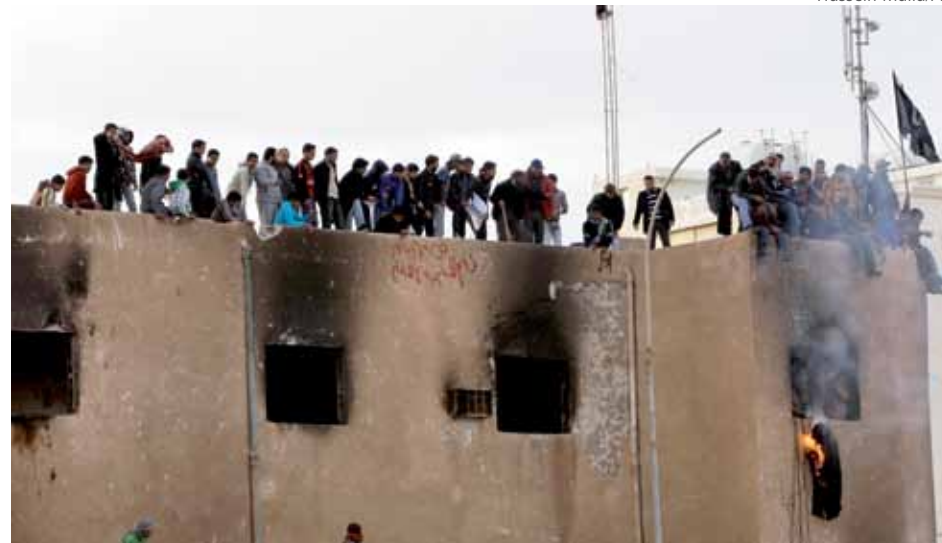
Sinais de desmoronamento do regime de Kadhafi

Kadhafi conseguiu esmagar a tentativa de golpe em 1975 e, em seguida, prosseguiu com seu programa. Acabou tomando a maior parte da economia e se inclinou em