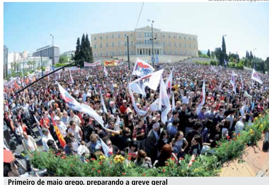
Primeiro de maio grego, preparando a greve geral

Na França foram convocadas mais de 200 passeatas em todo o país. Na capital, Paris, reuniram-se mais de doze mil pessoas.