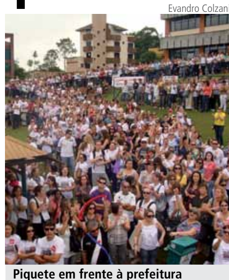
Piquete em frente à prefeitura

Os trabalhadores recusaram a proposta da Prefeitura por unanimidade em uma assembleia que contou com a presença de mais de