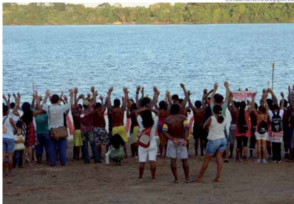
Manifestantes se despedem simbolicamente do Rio Xingu