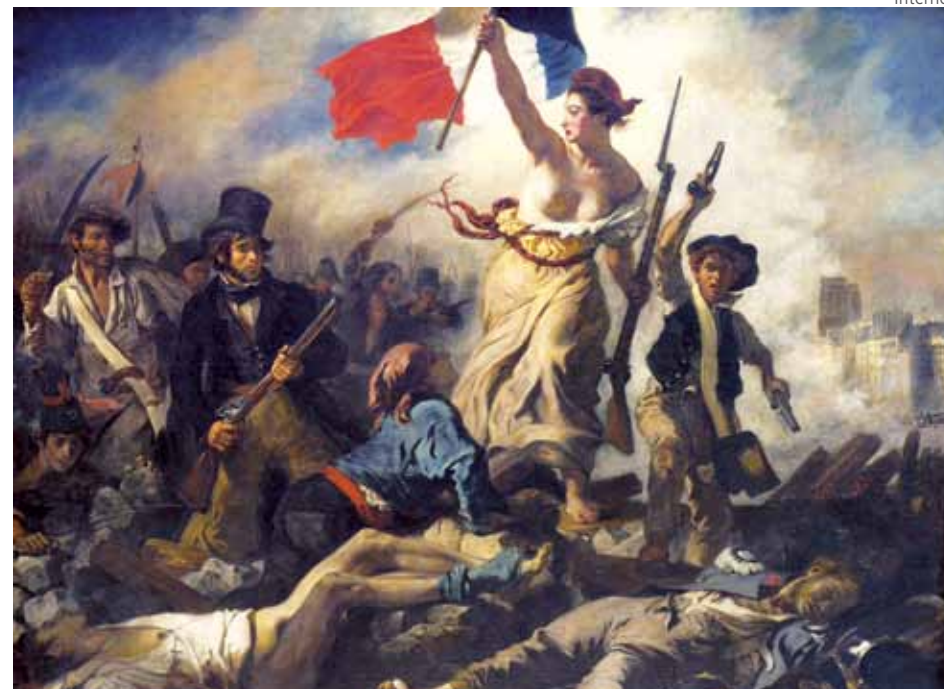
A Libertade guiando o Povo, pintura de Eugene Delacroix, 1830

de formação de novos sindicatos e de agitação operária que surgiu a AIT (1864-1872). Seus militantes conseguiram imprimir ao movimento dos trabalhadores o internacionalismo e a ideologia socialista, superando concepções anarquistas, blanquistas e radical-liberais que predominavam até então (e isso constituiu a principal contribuição dessa Associação ao movimento operário mundial). Longe de ser uma ação isolada e desesperada do povo parisiense, a Comuna de Paris de 1871 foi a expressão mais aguda de um período de ascensão da luta de classes, coincidindo com o auge do apelo popular da AIT.