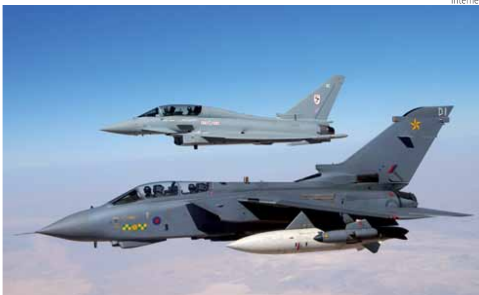
Aviões da Força Aérea Britânica preparam-se para atacar a Líbia