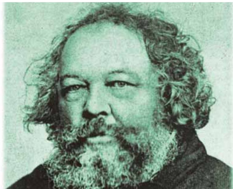
Retrato artístico de Bakunin