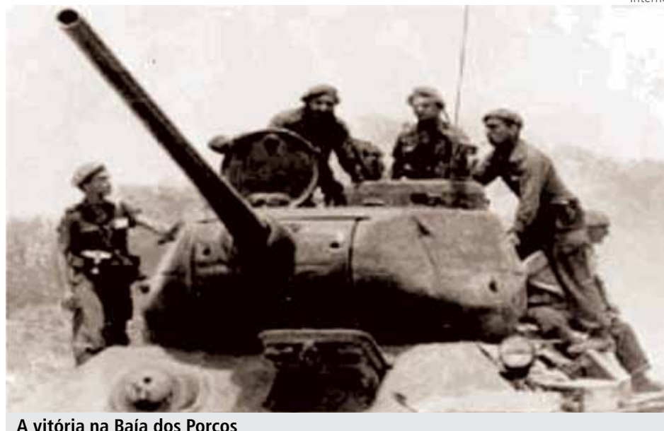
A vitória na Baía dos Porcos

contas a ninguém. Em uma situação de queda do poder aquisitivo, onde todos percebem a corrupção nas esferas do Estado, essas coisas podem se converter em um perigo para a revolução. Uma democracia operária, tal como assinalou Lênin, deve controlar a burocracia, com a eleição dos funcionários a cargos revogáveis a qualquer momento, e com o estabelecimento de um teto para as diferenças salariais, que deveriam ser reduzidas com o desenvolvimento da economia.