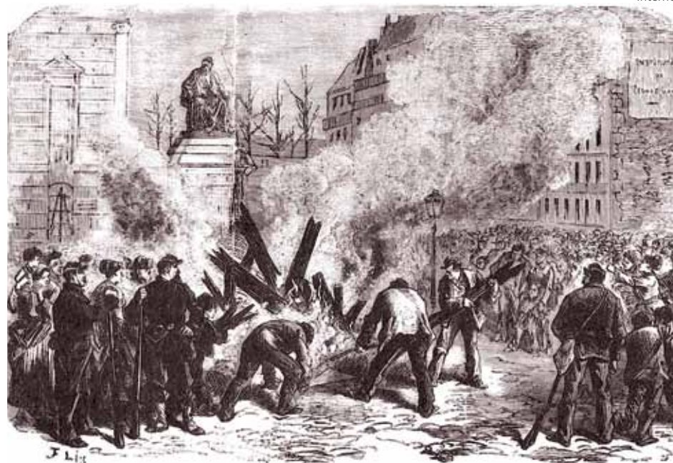
Revolucionários destruindo a guilhotina

Semanas antes, o frágil governo provisório francês se rende aos alemães, entrega os exércitos e permite que o Imperador da Alemanha seja coroado no Palácio de Versalhes. Depois de uma série de rendições em campos de batalha nos últimos meses de 1870, a capitulação oficial da França ocorreu em 28 de janeiro de 1871. Adolphe Thiers, velho político francês, foi eleito pela assembleia como chefe do executivo e solicitou uma trégua aos prussianos, que foi concedida por Bismarck. O acordo de trégua incluía a eleição de uma assembleia nacional francesa que teria a autoridade de firmar a paz definitiva – pois para os alemães a paz era sinônimo de rendição francesa, entrega de territórios e pagamento de altíssimas indenizações. A Assembleia Nacional Francesa reuniu-se em Bordéus, em 13 de fevereiro, nomeando Thiers o primeiro presidente