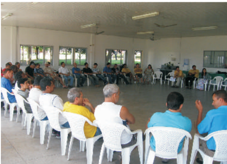
Assembléia de trabalhadores da Flaskô (13/06/2008)

Um ônibus de trabalhadores da IMPA e das fábricas recuperadas da Argentina estará no dia 4 de Julho em Joinville-SC, onde após a abertura do “Tribunal Popular para Julgar a Intervenção na Cipla e Interfibra”, trabalhadores de todo o Brasil, da Venezuela, da Bolívia, do Paraguai, Uruguai e outros países, vão comemorar a expropriação da fábrica numa grande confraternização.