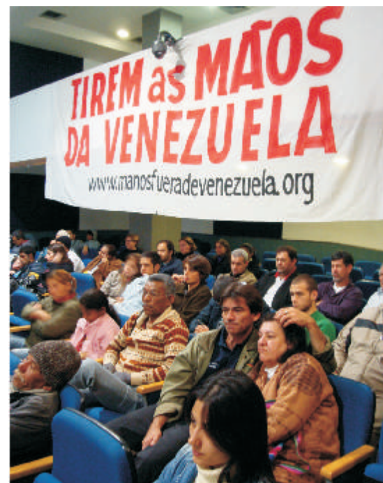
Conferência lota auditório da ALESP

formação de uma delegação brasileira para ir à Venezuela no período das eleições para prefeito e governador no país e reunir-se com Chávez convidando-o a vir ao Brasil na Conferência "Tirem as mãos da Venezuela" de 2009. Esta delegação levará seu apoio às candidaturas do PSUV que enfrentarão mais uma pesada campanha dos reacionários venezuelanos dirigidos pelo governo dos Estados Unidos.