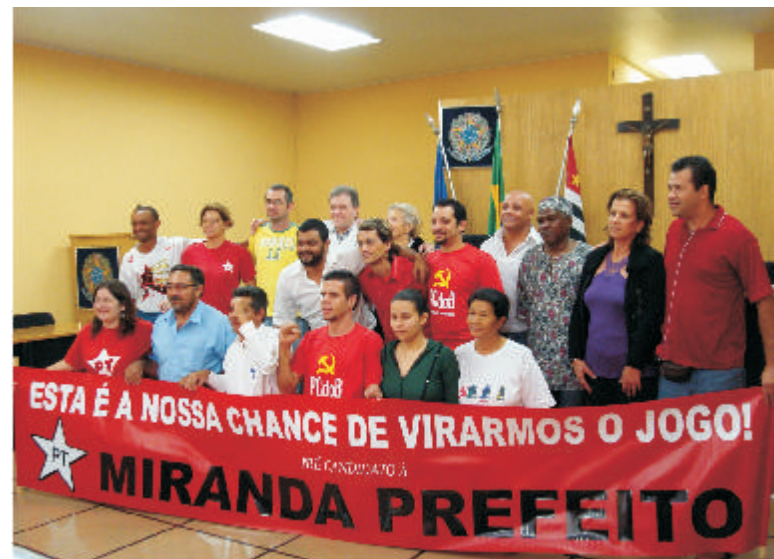
Chapa de pré-candidatos na convenção de 18/06 (PT e PC do B)

- “Essa importante vitória da base do partido e daqueles que se mantêm fiéis à sua classe e à luta pelo Socialismo só foi possível pela