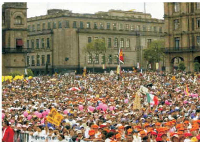
Trabalhadores se reúnem no Zócalo

A luta contra a privatização da PEMEX - estatal petroleira do México - entrou em uma nova fase. Depois de gigantescas manifestações populares e da ocupação dos plenários da Câmara dos Deputados e do Senado, que conseguiram barrar a votação em regime de urgência da Reforma Energética, o Movimento Nacional de Defesa do Petróleo está organizando uma Consulta Popular sobre a Indústria Petroleira em todo o país. Nos quinhentos municípios governados pela Frente Ampla Progressista (FAP) - que reúne os principais partidos de oposição - a Consulta vai se realizar em 27 de julho. Nas outras localidades, a consulta