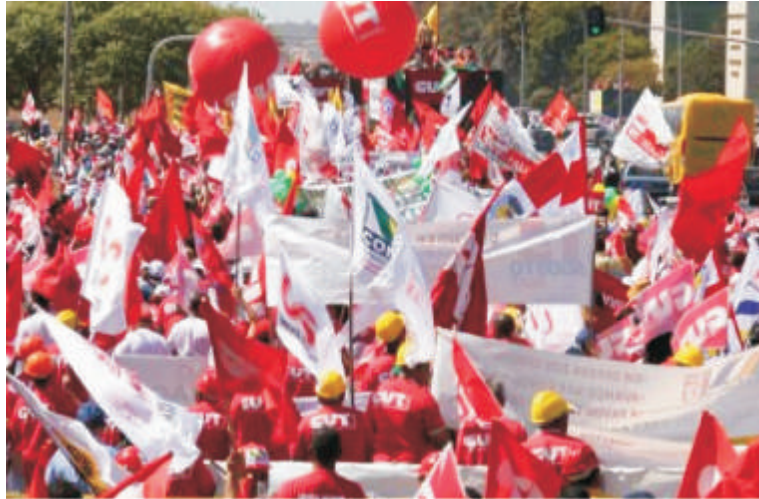
Marcha da CUT contra a emenda 3

Mais recentemente, a CSC/PCdoB rompe com a CUT e cria a CTB. A CSC, desde que entrou na CUT em 1991, integrou a direção majoritária e afiançou todas as políticas que levaram à burocratização da central. No congresso do SINPRO a política oportunista da CSC foi desmascarada. Falam em “autonomia e liberdade sindical”, mas se agarram com unhas e dentes na unicidade imposta pelo estado e que tem como base de sustentação o famigerado imposto sindical. Neste ponto estão de pleno acordo