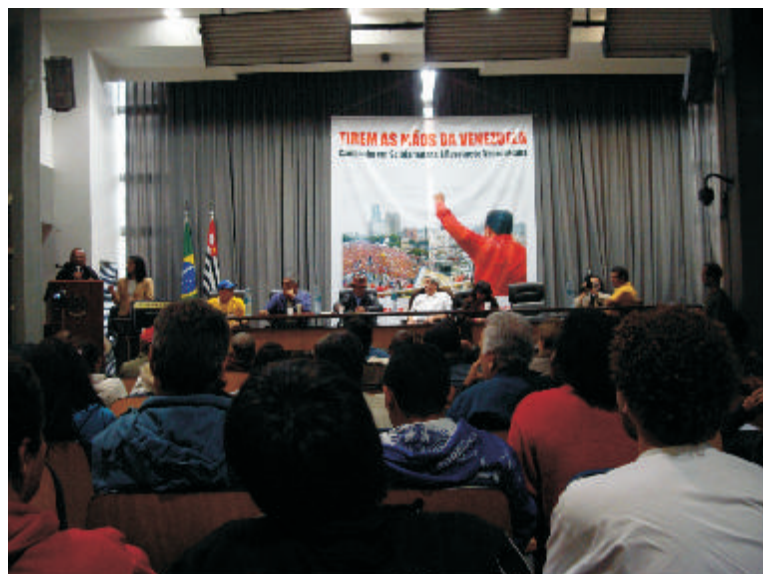
Mesa com convidados internacionais

Encerrada com muitas palavras de ordem todos os presentes eram unânimes em ressaltar o êxito e o extraordinário clima militante e combativo da Conferência.