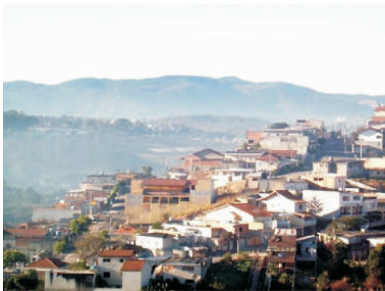
Terreno irregular característico forma os morros de Caieiras

9 de Agosto: Festa de Lançamento no SERC, no centro de Caieiras a partir das 19h