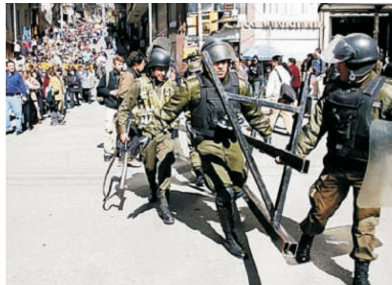
Conflitos durante o referendo da autonomia

Nada garante também que a simples compra de ações seja suficiente para transferir os benefícios desses setores para o Estado e muito menos para o povo. Aliás, é o que tem acontecido com o petróleo, gás e minérios. Apesar de um aumento na arrecadação federal devido à