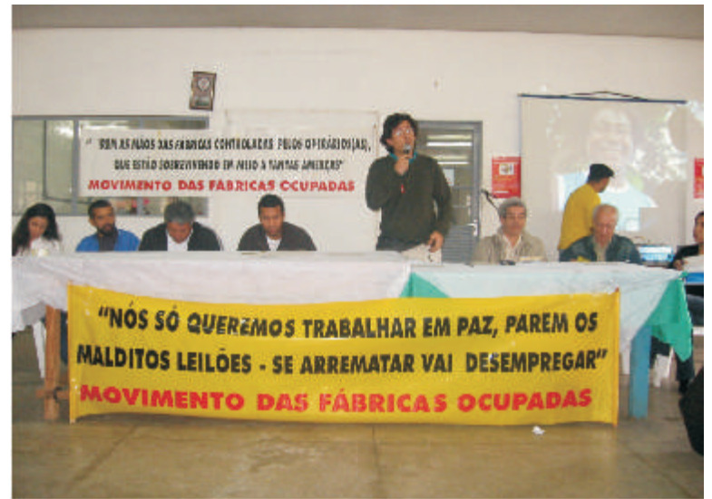
Mesa do encontro de cinco anos de controle operário

Dois encaminhamentos principais saíram do Encontro. O primeiro é a realização de um ato público em frente ao Fórum de Sumaré, no dia 24 de junho, pois mais um leilão de máquina está marcado para acontecer nesse dia. As faixas: