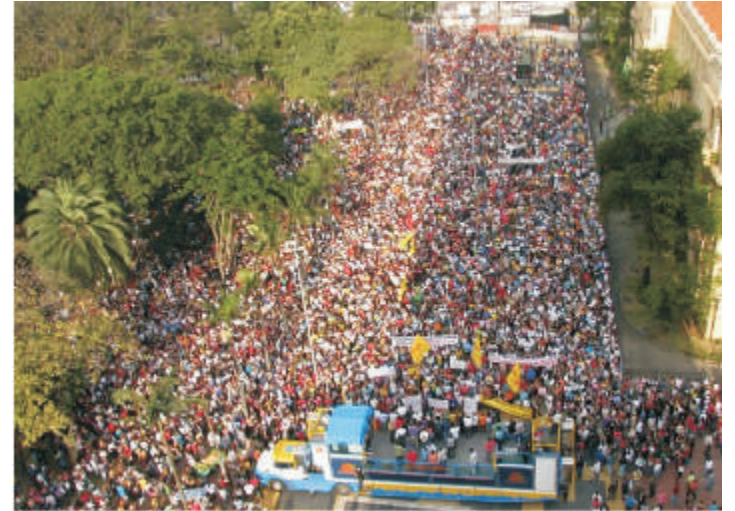
Assembleia na Praça da República

O tal decreto consiste em limitar a remoção de professores entre escolas. Isso é ruim, pois muitos professores se efetivam, por falta de opção, em uma escola longe do local onde moram (muitas vezes em outra cidade) e por isso se utilizam do artigo 22 da lei 444/85 para serem removidos a uma escola mais próxima substituindo um professor dessa unidade. O