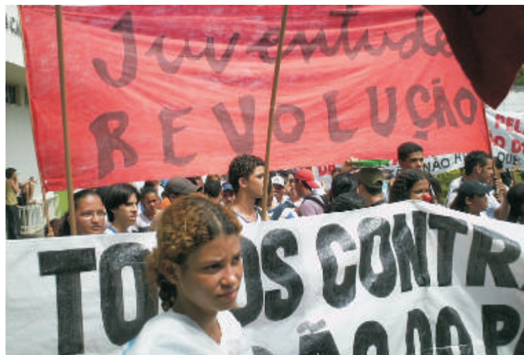
Militantes da JR de Cuiabá em ato contra restrições ao passe-livre

Ramirez: Esse ano está completando 40 anos de um dos episódios que mais marcaram o Movimento Estudantil e a luta pela liberdade no Brasil. Há exatos 40 anos o imperialismo, se utilizando da ditadura militar, pensou que podia acabar com a luta da juventude, e invadiram o Congresso da UNE que se realizava no Sítio Muduru em Ibiúna-SP. Para nós é simbólico, estamos continuando a luta pela liberdade